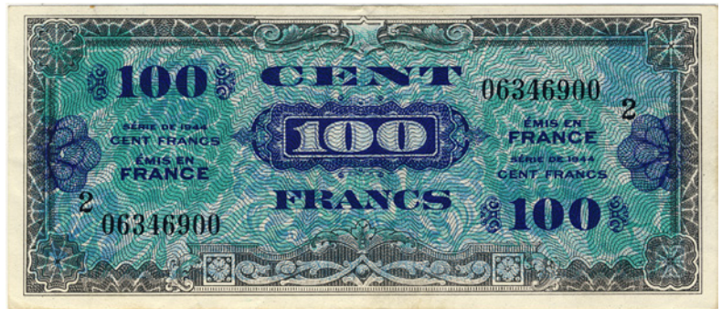
Avers du VF20.2. Collection FBOW. Acheté sur ebay en mai 2010.