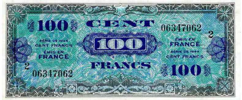
Exemplaire en état NEUF vu en vente à 250 euros sur ebay en février 2016 (le billet est plutôt SPL).