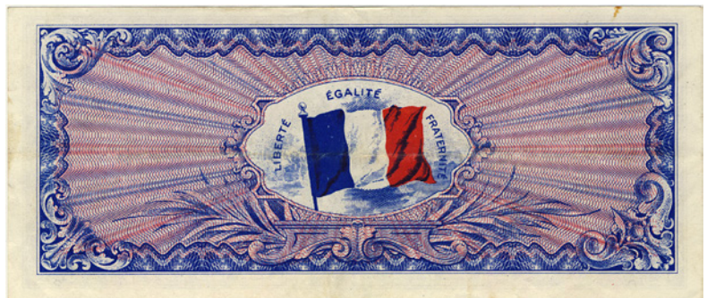
Avers du VF20.2.